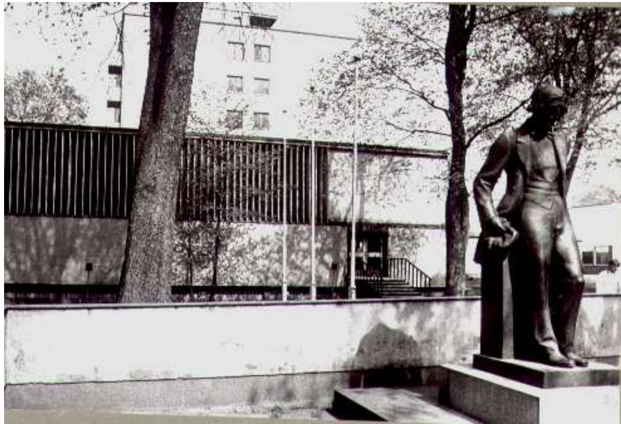
Kirjailija Julius Wecksellin patsas Åbo Akademin kirjaston edessä.