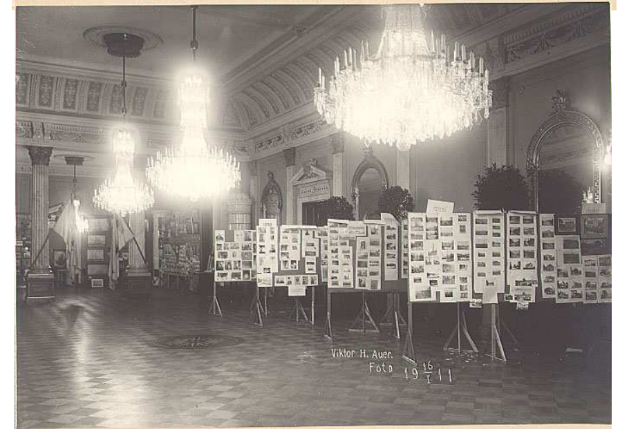
Kuvakokoelmat esiteltiin yleisölle vuoden 1911 alussa Turun kaupungintalossa järjestetyssä näyttelyssä.